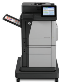
МФУ HP Color LaserJet Enterprise M680F