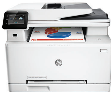
Цветное МФУ HP Color LaserJet Pro M277dw

Мощные возможности в компактном корпусе. Данное МФУ с оригинальными лазерными картриджами HP, поддерживающими технологию JetIntelligence, представляет собой идеальное решение со всеми необходимыми функциями для эффективной работы.