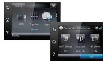
Обзор панели управления